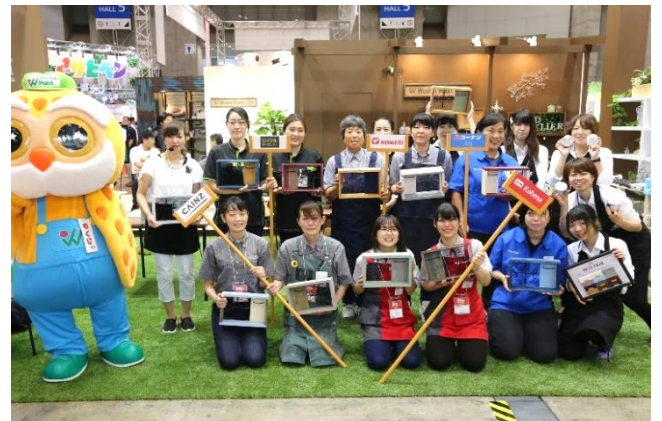
計15社 全国の主要なホームセンターのスタッフの方が集まりました。