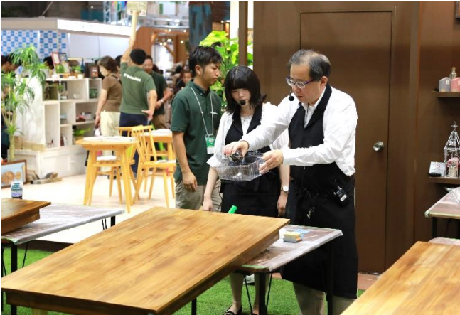
ニス塗り実演 食卓テーブルの塗り替え