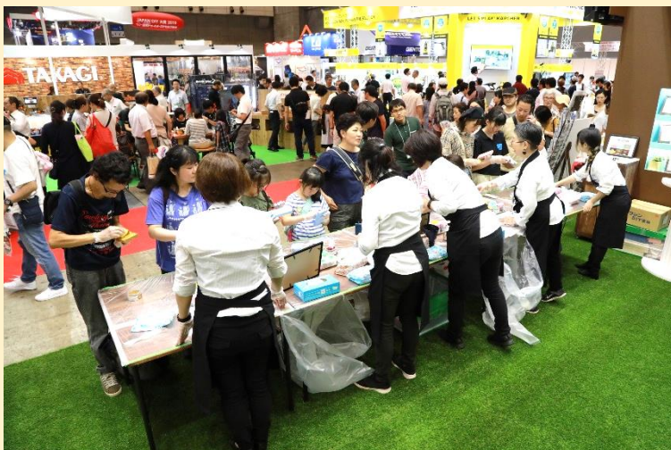
ブースのまわりは順番待ちの長い列が、130名の方が体験されました。