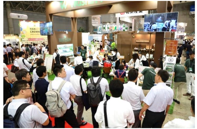
第一回 29日(木) AM