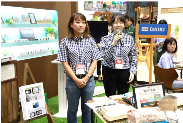
最初に各企業のメンバーの紹介と一言 PR。ちょっと緊張！