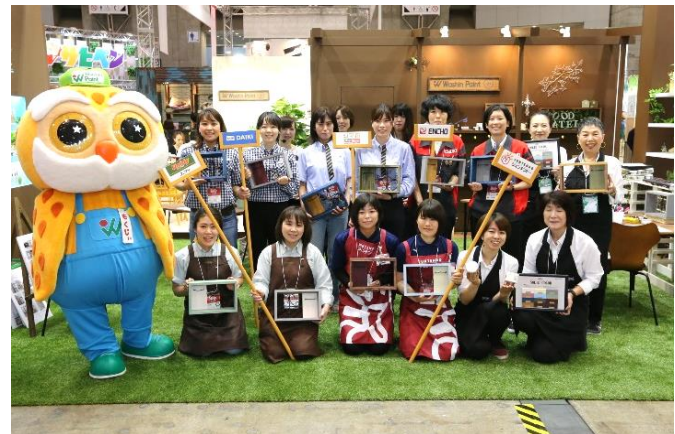
第三回 30日(金) PM