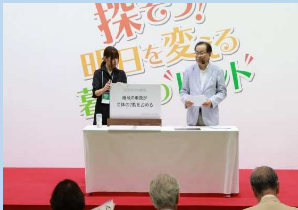
新製品開発委員会で検討している「すべりにくいニス」ニスプレゼンを行いました。最終日にはお客様からアンケートをとり効果を確認していただきました。