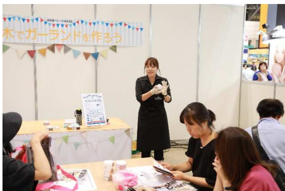
これまでの木部用塗料にはない色あいをそろえています。