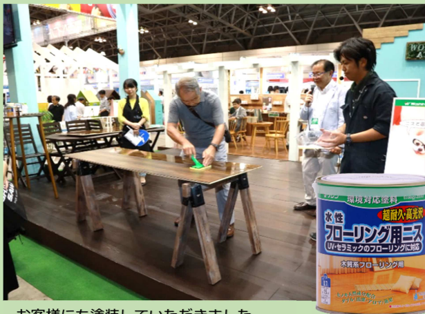
お客様にも塗装していただきました。