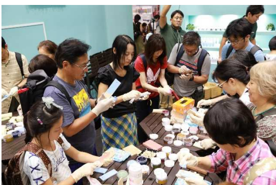
アルコールの含まれていないウェットティッシュで拭き取ります。