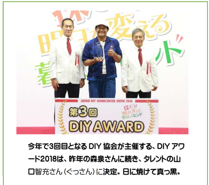
今年で3回目となる DIY 協会が主催する、DIYアワード2018は、昨年の森泉さんに続き、タレントの山口智充さん(ぐっさん)に決定。日に焼けて真っ黒。