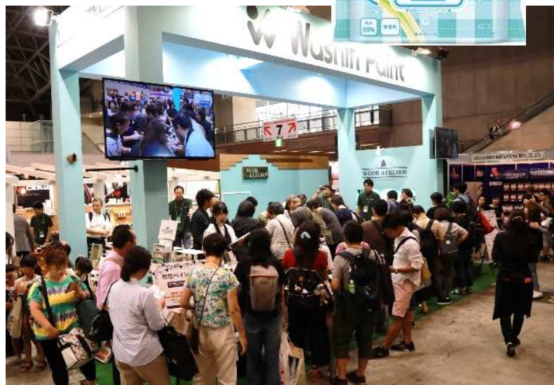
体験待ちのお客様でブースをお客様がぐるりと囲みました。